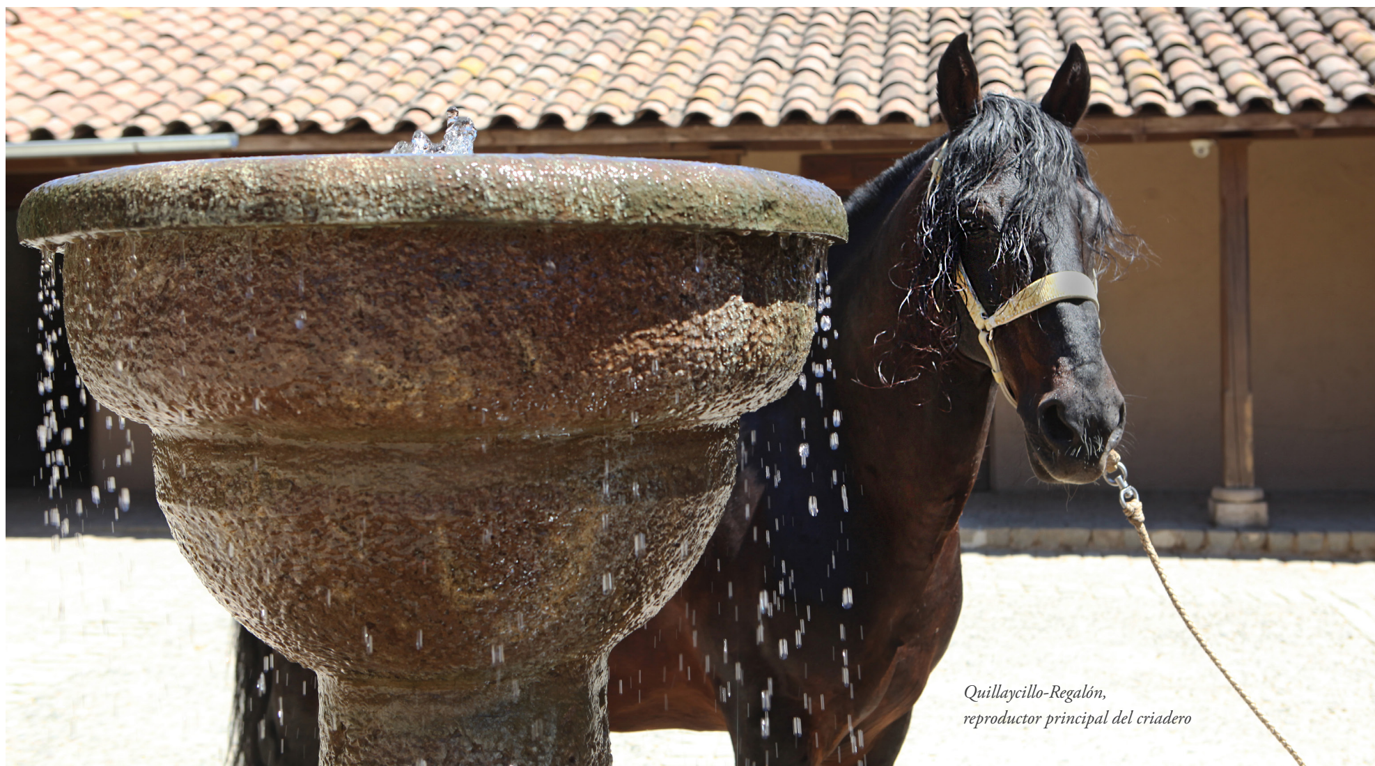
Quillaycillo-Regalón, reproductor principal del criadero